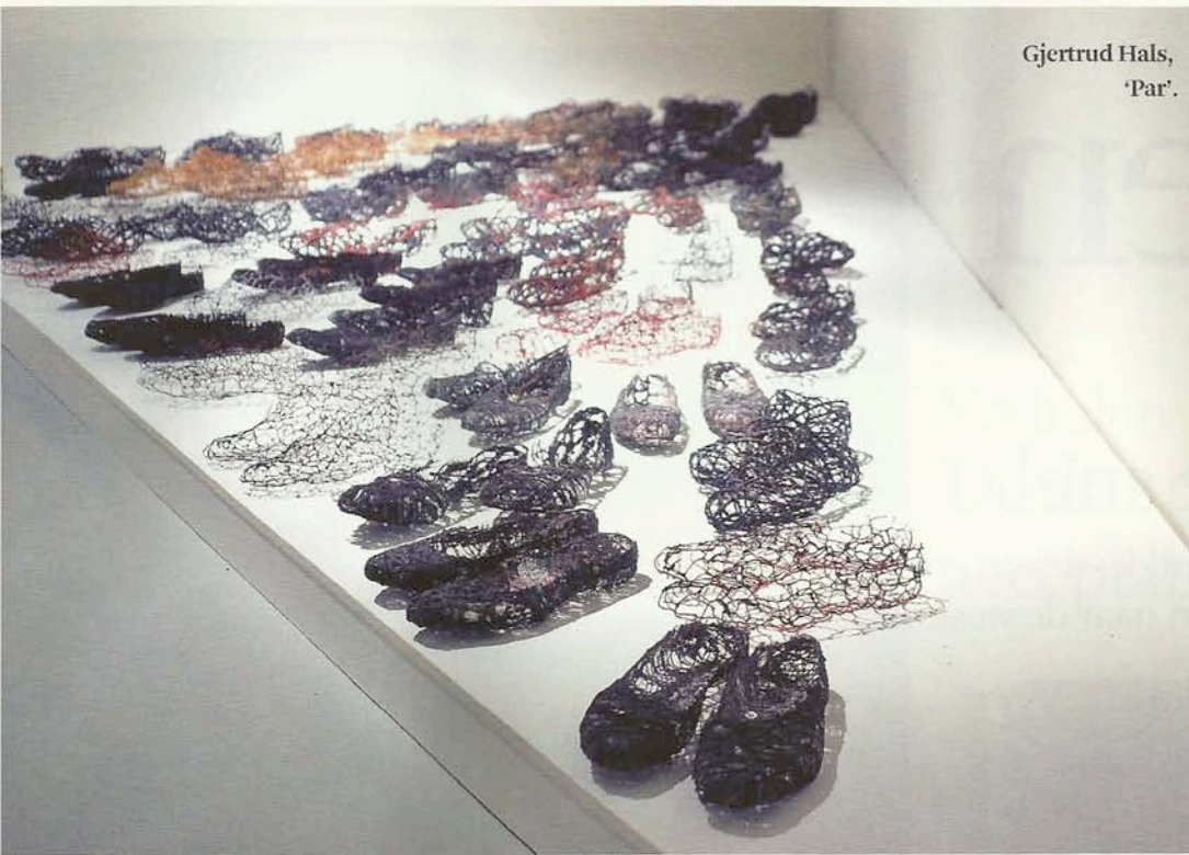
Gjertrud Hals, 'Par'.